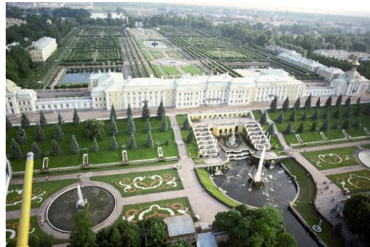
б) Дворцово-парковый ансамбль Петергоф