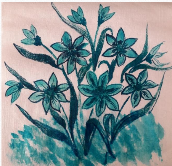
Рисунок наносится легко, цвет яркий

После стирки с применением механических воздействий